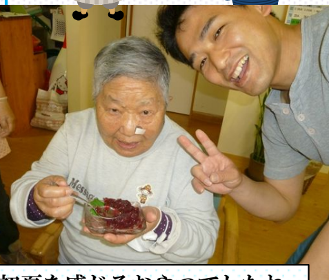
初夏を感じるおやつでしたね