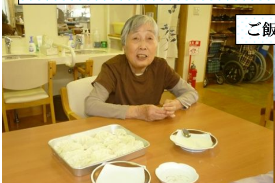
ご飯作りでは「餃子」を作りました♪