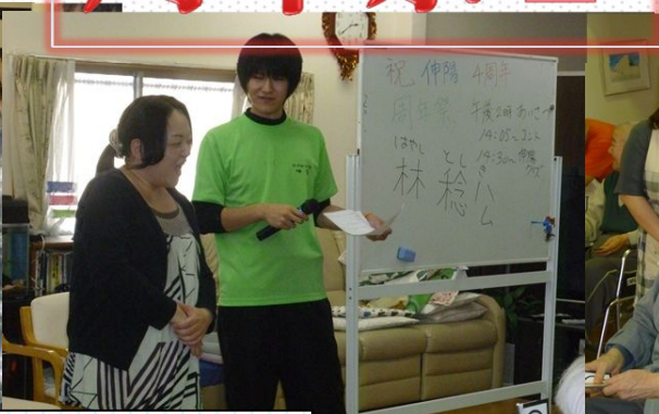
クイズの内容は伸陽の職員に関する内容です♪