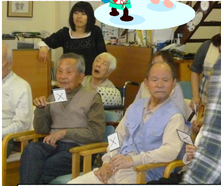
コントの後は「伸陽クイズ」を行いました。