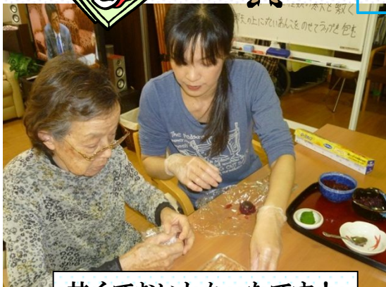
甘くておいしかったです！