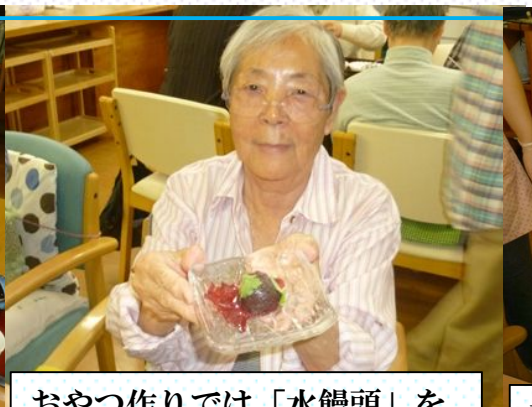
おやつ作りでは「水饅頭」を作りました♪