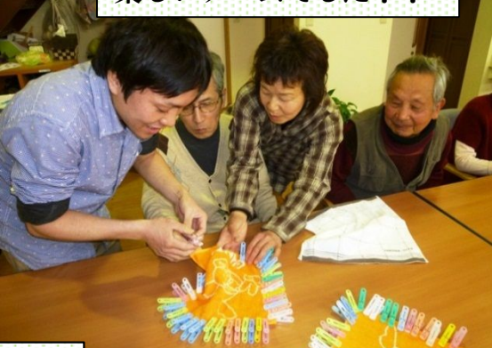
続いてのゲームは「一反木綿」ゲームです♪