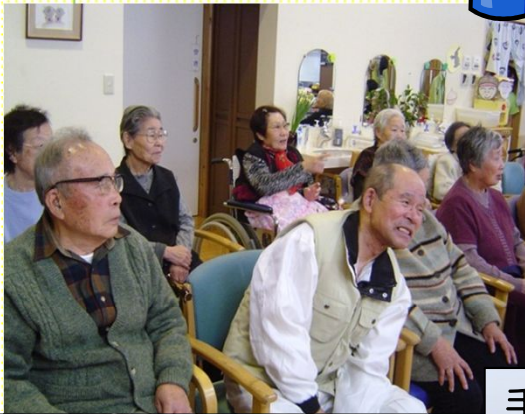
たくさんの手品を披露していただきました。