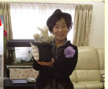
驚きの連続でした！！ 楽しい手品を、ありがとうございました。