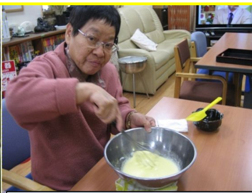
この日は、デコレーションマフィン作りをしました！