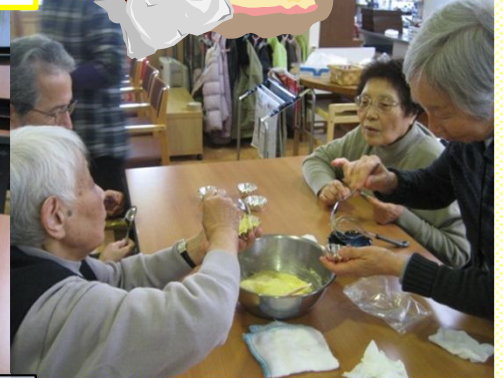
おいしく完成しました☆