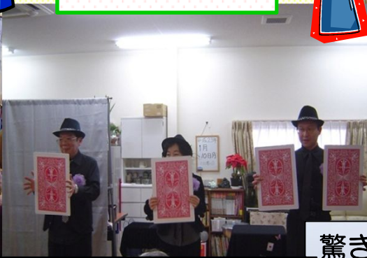
手品ボラの「マジックワン・ツー・スリー」の皆さんです☆